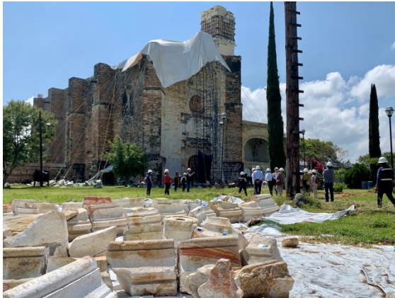
Le chantier de l'église de Huaquechula

La délégation s'est rendue sur le chantier de l'église franciscaine de Huaquechula , à la restauration de laquelle la France contribue. Dans le cadre de ce chantier, la France apporte son expertise pour former des professionnels et des artisans mexicains aux enjeux et techniques de la restauration du patrimoine.