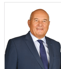
Serge Babary , Sénateur d'Indre-et-Loire, Président de la Délégation